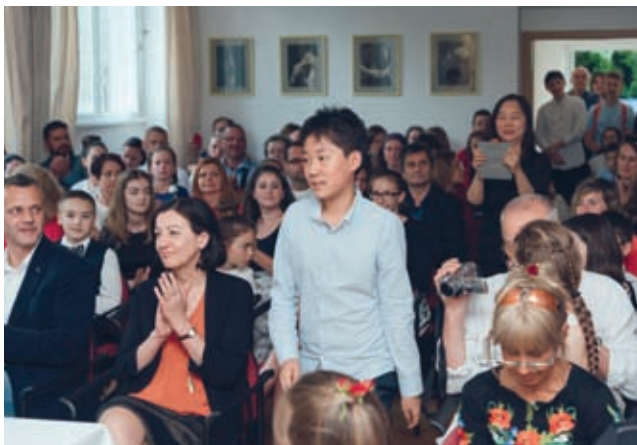
Fotografia zachyt va sl vnostn  udeľovanie ocenen  v hudobno-interpretáčnej s taži Nitrianska lutna.